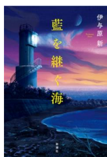
第172回直木賞受賞 藍を継ぐ海（新潮社刊） 伊与原新／著