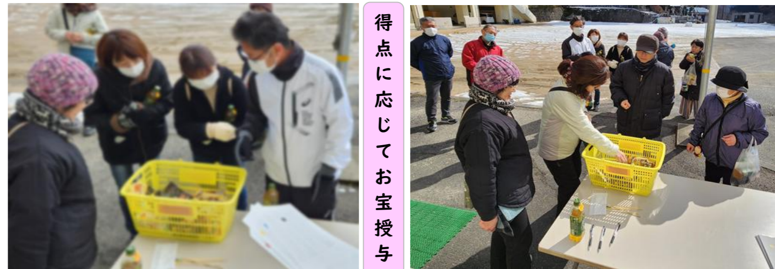
得点に応じてお宝授与