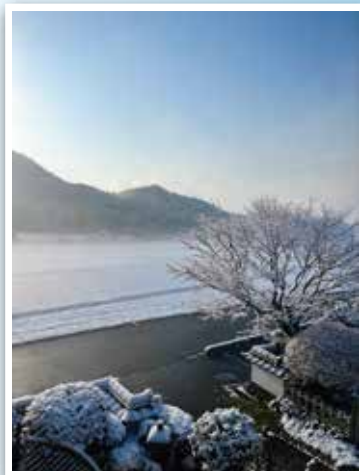
▲第6回 優秀賞受賞作品

後援：周南市、周南観光コンベンション協会、新周南新聞社、CCS、カメラのキタムラ周南店、カメラのワタナベ