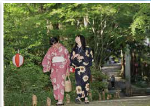
▲第6回 優秀賞受賞作品