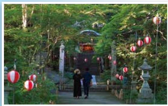
▲第6回大賞受賞作品

「写真文化のまち・鹿野」の魅力を発信し、全国の写真愛好家と地域住民の交流を深め愛されるフォトコンテストを目指しています。