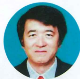
富田東地区まちづくり協議会