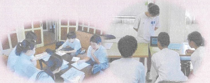
楽しく歴史の学習をしている中学生