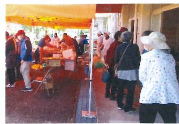
【 体振:おでん、炊き込みご飯等 】