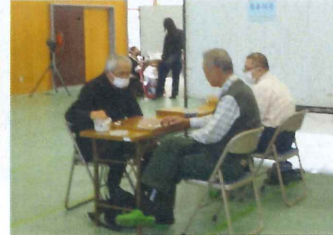
【 囲碁対局 】