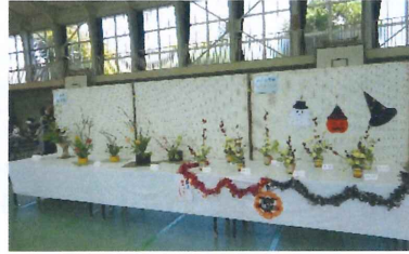
【 小原流生け花・生け花クラブ 】