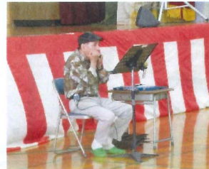
【 ハーモニカ演奏 】