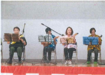
【 ウクレレを楽しむ会 】