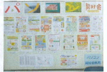
【 パソコン同好会 】