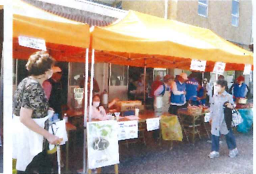
【 コミュニティ:コーヒー等 】