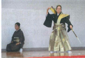
【 日本舞踊(若柳流) 】