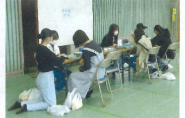
【 オセロゲーム 】