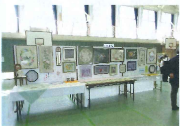
【 戸塚刺しゅう 】