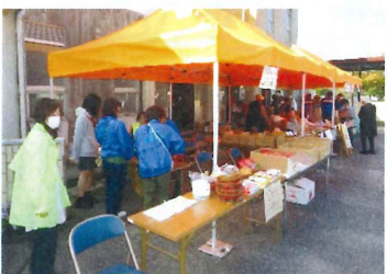
【 社協:パン、りんご、花苗等 】