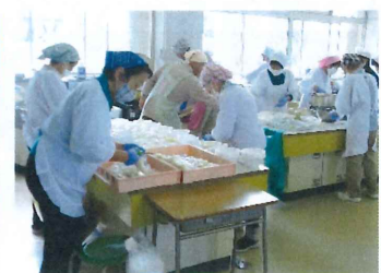
【 団塊塾:うどん 】