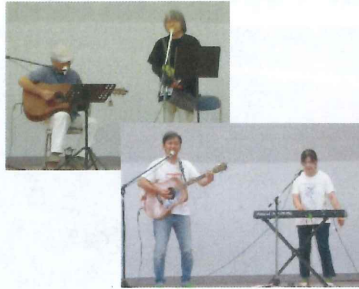
【 あきみん音楽会 】