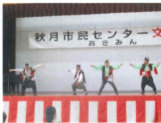
【 WDひまわりの会 】