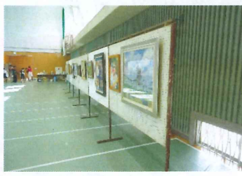
【 絵画教室 】