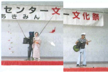
【 いづつカラオケ教室 】