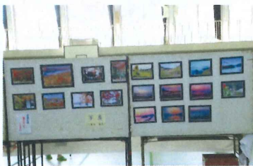
【 写 真 】