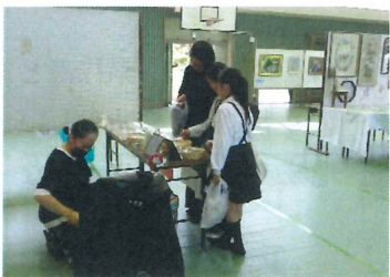
【 体振:手作りアクセサリ 】