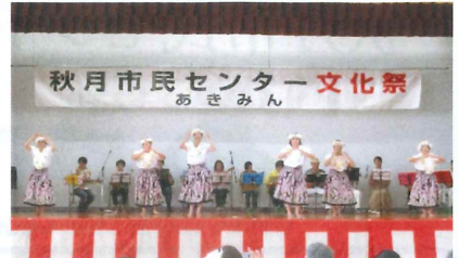
【 ハワイアン・フラ 】