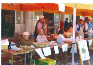
【 パソコン・団塊:野菜等 】