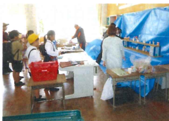
【 体振:射 的 】