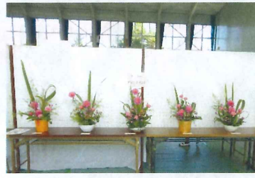
【 フラワーアレンジメント 】