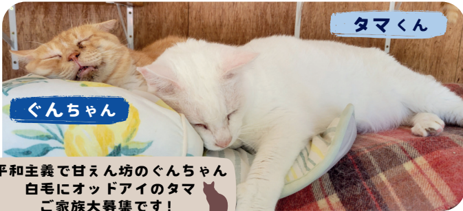
平和主義で甘えん坊のぐんちゃん 白毛にオッドアイのタマ ご家族大募集です！

スタッフブログ『KEDAMA日和』も随時更新中！ Instagramでも日々の様子を発信しています