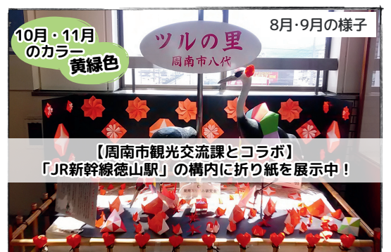
10月・11月のカラー 黄緑色 ツルの里 周南市八代 8月・9月の様子

TEL：080-1942-9222 メール： kuniom1119@outlook.jp