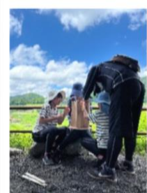
家族みんなで木工体験