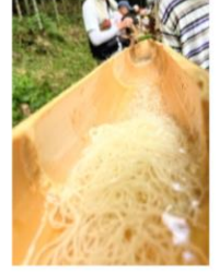
手作り竹細工で流しそうめん