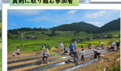
じゃがいも植え付け中