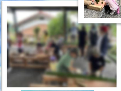
竹で食器を作成中