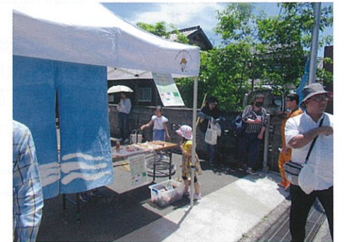
放課後教室もブースを出して参加しました。