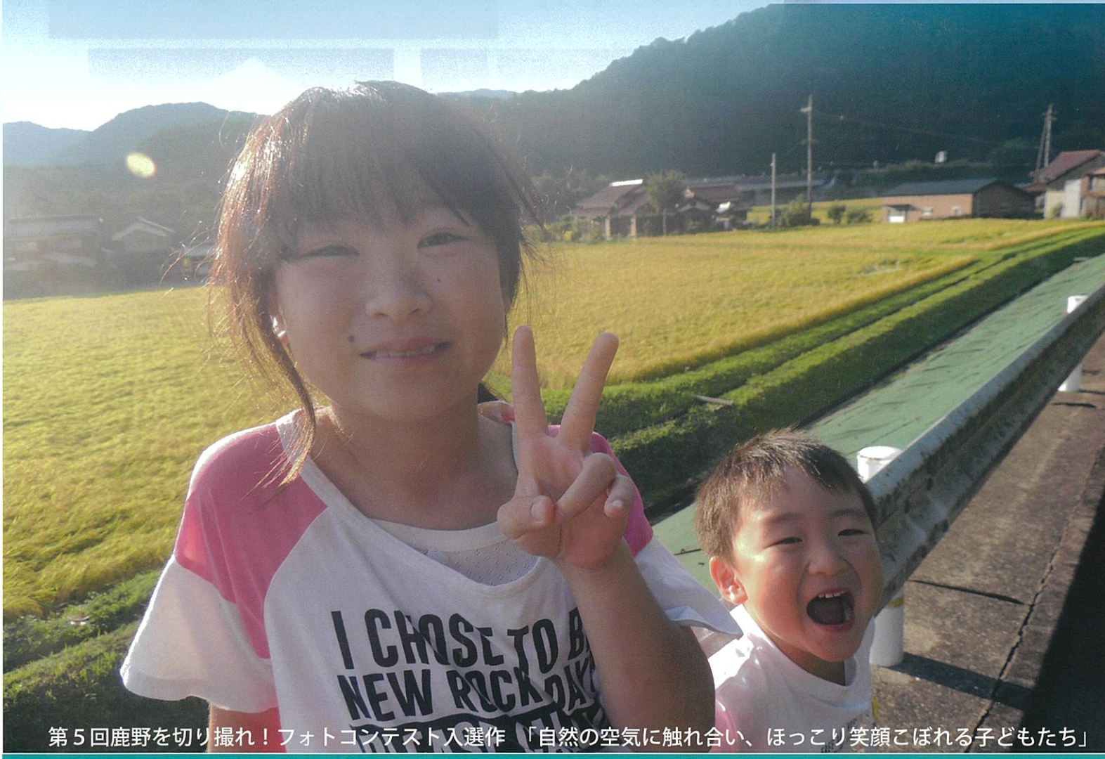
第5回鹿野を切り撮れ!フォトコンテスト入選作「自然の空気に触れ合い、ほっこり笑顔こぼれる子どもたち」