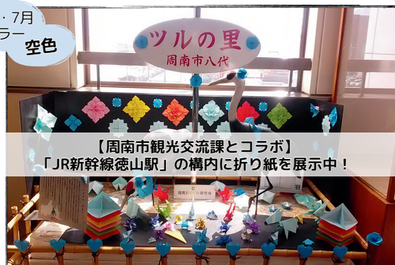
【周南市観光交流課とコラボ】 「JR新幹線徳山駅」の構内に折り紙を展示中!