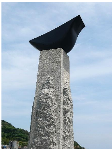
“ふぐ漁発祥”モニュメント

注:発熱、せき、のどの痛みなどの症状ある方は、参加をご遠慮下さい。 歩行中のマスク着用は各自の判断としますが、交通機関の利用、会話の時はマスク着用とします。