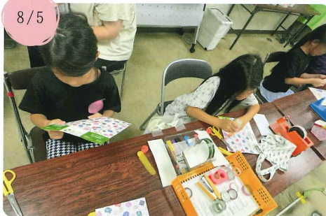
【周南消費者協会】 マイ♥小物入れをつくろう！