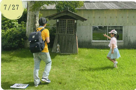
【山口狛犬楽会】 ガンガン行こうぜ！しゅうなんクエスト