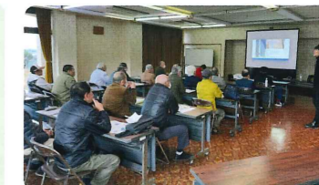
他団体との合同研修 (R5年度事業)