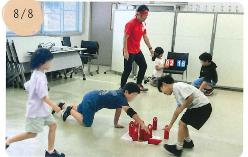
【和田の里づくり推進協議会】 和田モルックであそぼう！