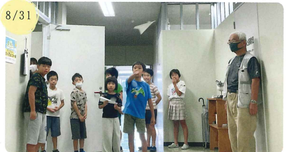
【周南少年少女発明クラブ(NPO法人山口県アクティブシニア協会)】 作ってみよう！3種類の紙ヒコーキ