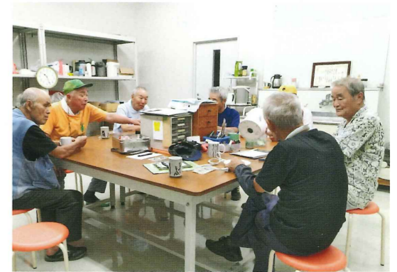
休憩中は和気あいあいとした雰囲気です