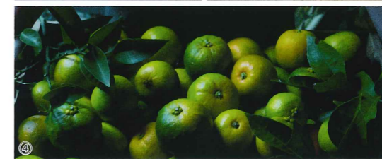
①島食堂ひなた ②チキンカレー ③SUDOMIすだいだいシロップ ④すだいだい