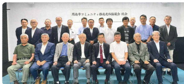
集合写真 (R6年度総会にて)