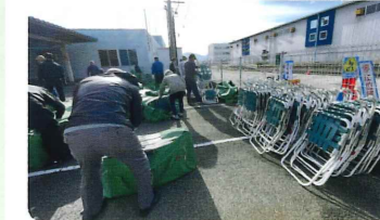
イベント備品整備 (R5年度事業)