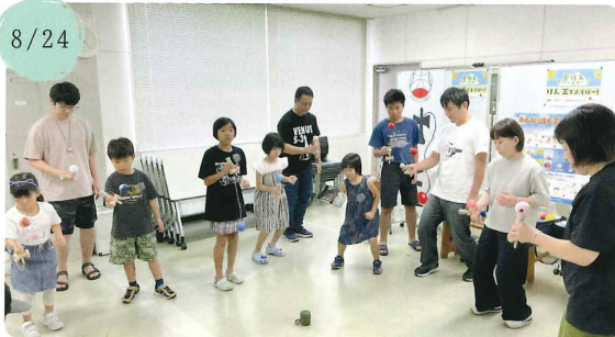
【周南けん玉教室】 けん玉であそぼう！