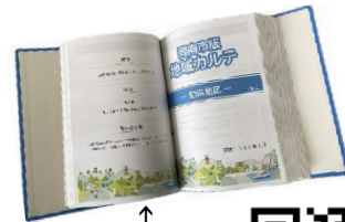
↑ 各地区配布の冊子

各地区の市民センターには、印刷した冊子もありますし、財団のホームページからの閲覧も可能です。どうぞ皆さんの地域活動にお役立てください。