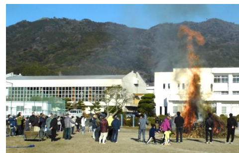
沢山の方にご参加いただきました！