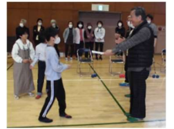
児童からの「ちょうせん状」！