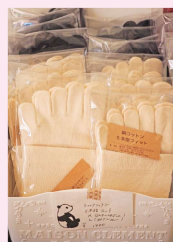
◀冷えとりのアドバイスと商品販売も!

須々万で育ち、現在も須々万で暮らす私自身が一番リラックスできる場所であり、サロンに来られる方にも日常から少し離れて須々万の澄んだ空気を感じてもらいたいと思い、須々万を活動拠点にしました。