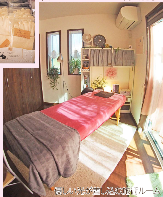
優しい光が差し込む施術ルーム

最近、自律神経とリンパの関係が注目を浴びています。元来、私たちの体に備わっている『めぐる力』を強化することで体の不調を改善し、自律神経のバランスを整える。体が整うと自然に心も整ってきます。リンパ浮腫でお困りの方はもちろん、忙しい日々の中で心や体の不調を感じている方が、日常から少し離れてリラックスしながら心と体のメンテナンスをしていただければ幸いです。