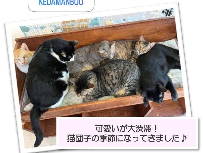
可愛いが大渋滞！ 猫団子の季節になってきました♪