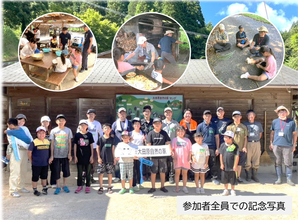
参加者全員での記念写真

7月30日(日)、中須北にある大田原自然の家周辺にて小・中学生が昼食のピザ作りと川釣り体験をしました。ピザ作りは材料をこねて生地を作り、発酵させ、焼き上げ食べるまで全てに取り組みました。釣りでは竿を自作し、ミミズを餌に小川でハヤなどを釣りました。