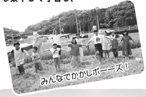
みんなでかかしポスター!!