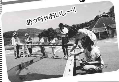
めっちゃおいしー!!

7月26日(水)~28日(金)、市民センターで真夏の学校を開催し、夏休みの宿題や体験活動に取り組みました。今年は開催を1日増やし、「木のカレンダーづくり」、「習字教室」、「かかしづくり・そうめん流し」を行いました。みんな集中して学習し、元気いっぱい遊びました。