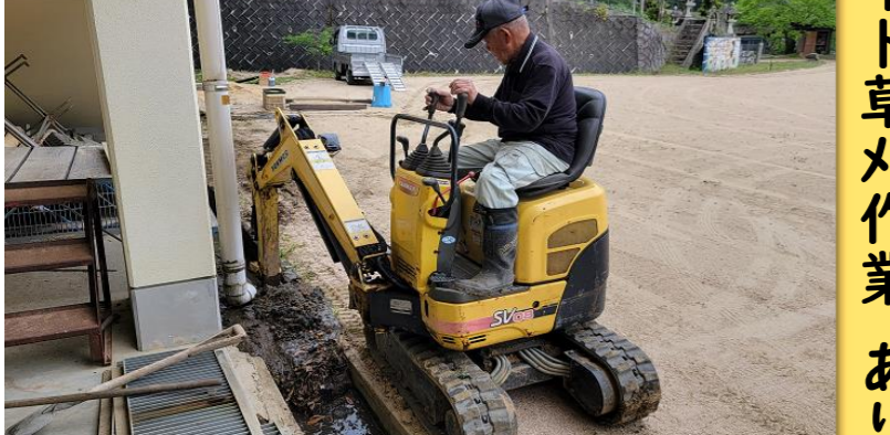
上流から流れてくる土砂と落葉でいっぱい