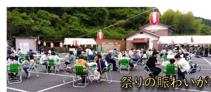
祭りの賑わいがかもどって来ました!