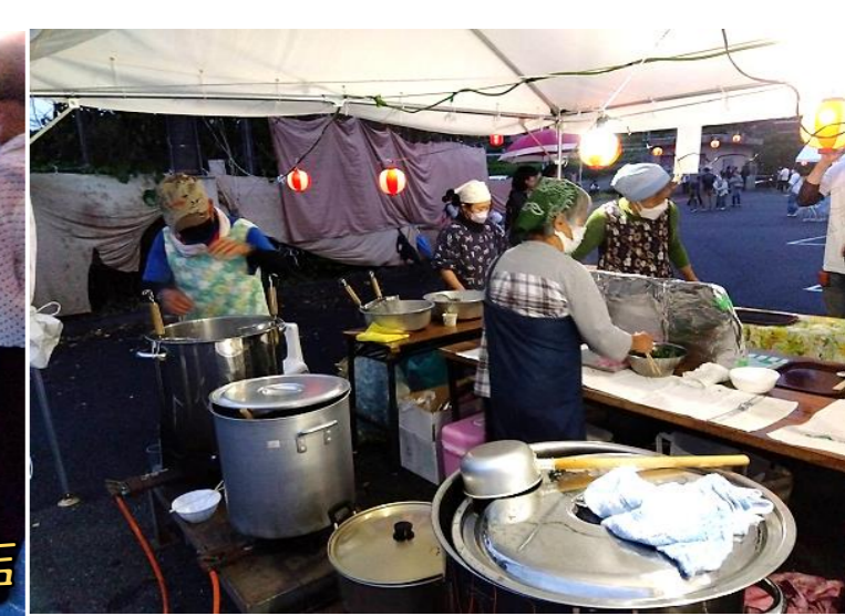
飲食を伴う出店がやっとできました!