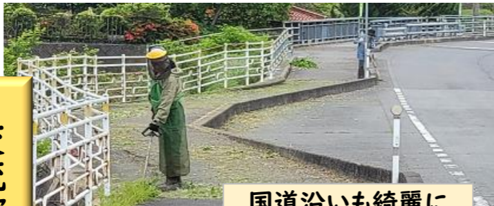
国道沿いも綺麗に