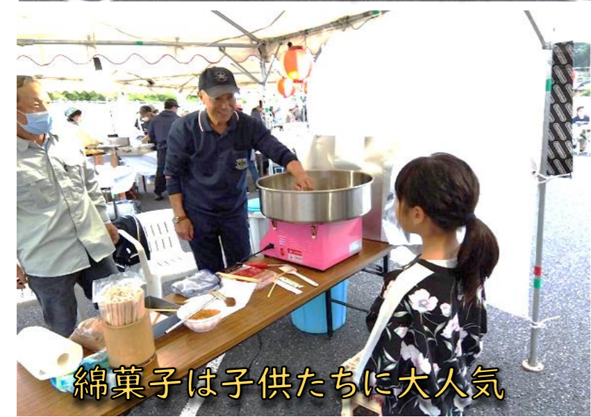
綿菓子はお子たちに大人気