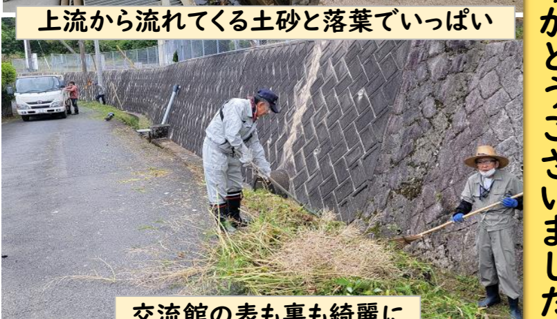
交流館の表も裏も綺麗に