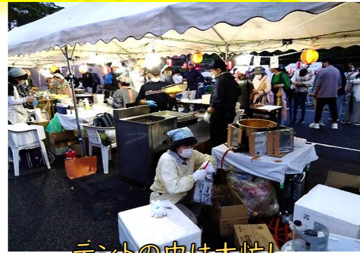
テントの中は大忙し