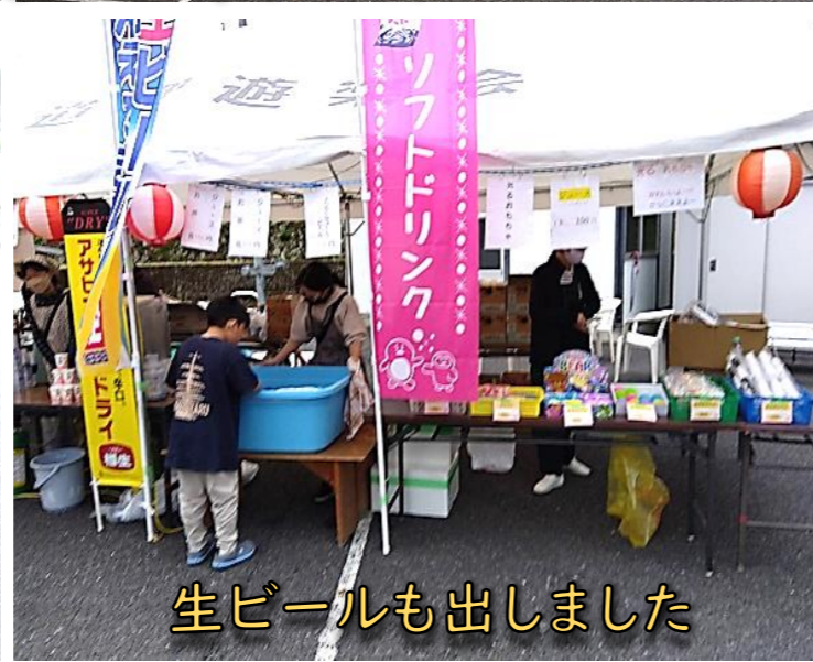
生ビールも出しました