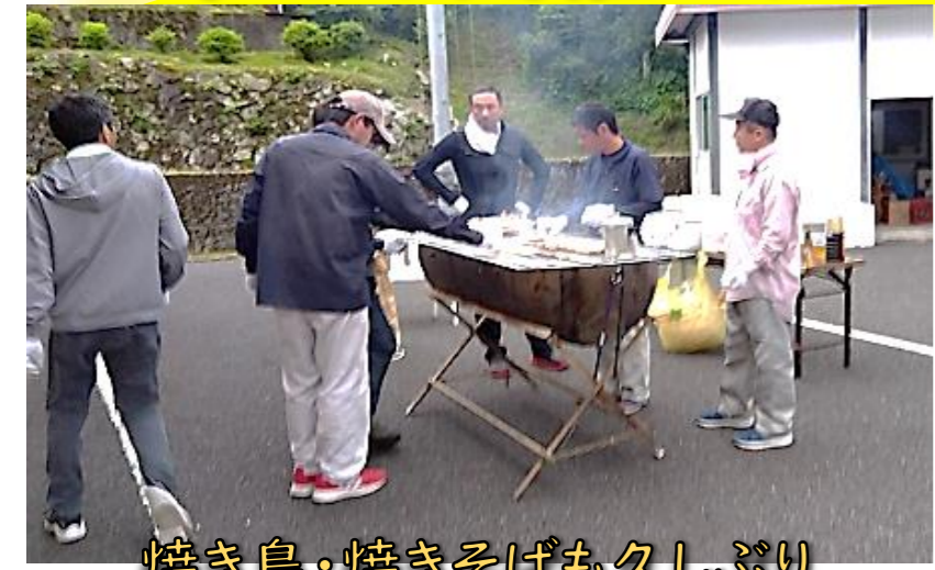
焼き鳥・焼きそばも久しぶり