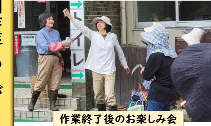
作業終了後のお楽しみ会