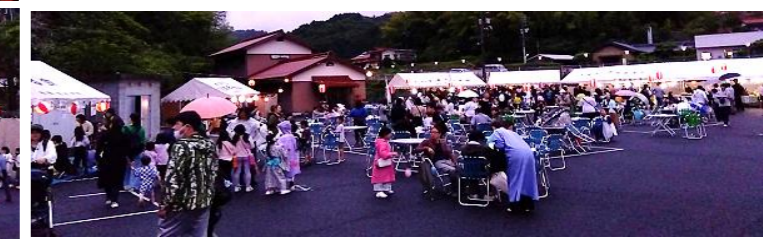
多くの来場者がありましたが雨が思いのほか早く降りだしました