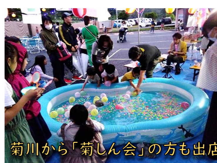
菊川から「菊しん会」の方も出店