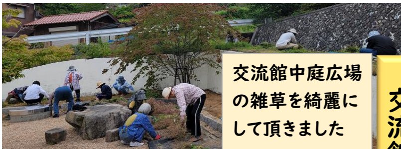
交流館中庭広場の雑草を綺麗にして頂きました