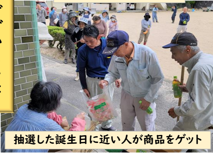
抽選した誕生日に近い人が商品をゲット