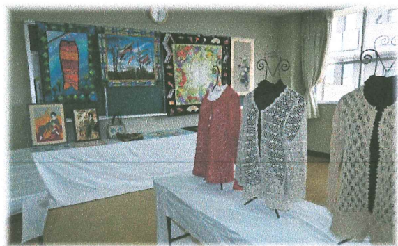
パッチワークと手編みの手の込んだ作品