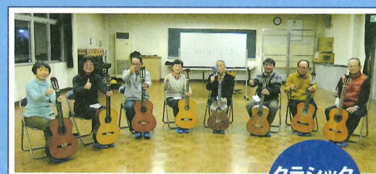
クラシック ギター教室