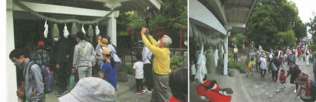
ブチまち史跡めぐり「熊野神社」(権現神社)「徳山百樹」である迫力のくすの木!は必見!