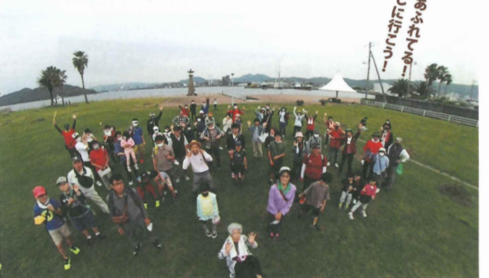
目的地「晴海親水公園」にて記念撮影!