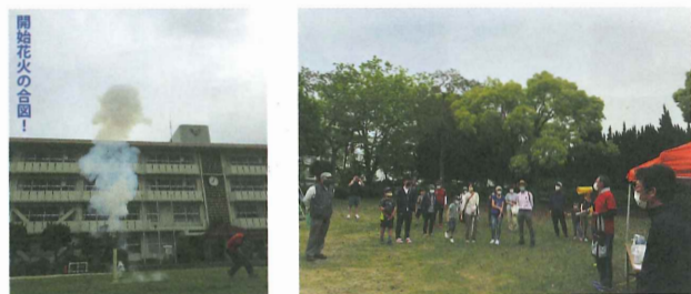
岡田原西公園をSTART/GOALに9時から、いざ出発!

コロナ禍で中止されていた、「今宿歩け歩け大会」が2年ぶりに開催されました。今回は、晴海親水公園までの往復で、道中まちの史跡をめぐる。健康と故郷発見の一石二鳥の企画で、コロナに負けない、体力づくりと地域づくりの1日になりました!