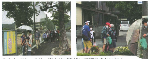
みんなでゆっくり。道中はゴミ拾いで街をきれいに!