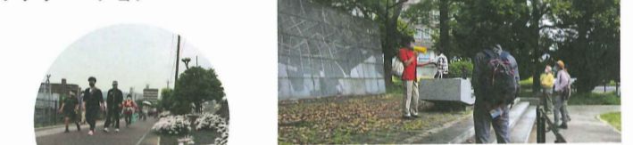
代々木公園の石碑の説明