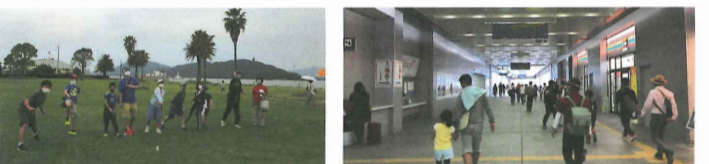
「晴海親水公園」でレクリエーション 帰り道はルートを変えて駅を渡って