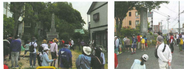
ブチまち史跡めぐり「追祭記念碑」と「皇太子殿下下行啓記念碑」