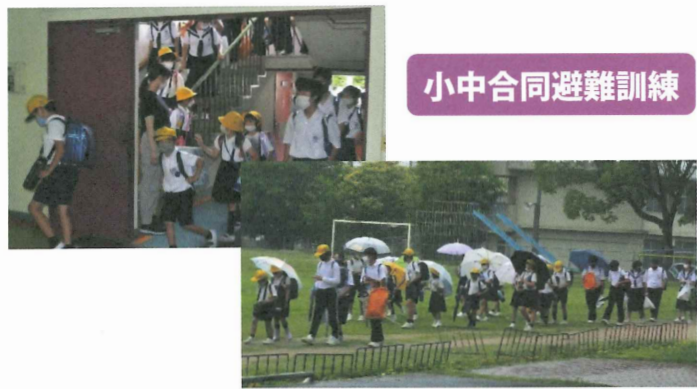
小中合同避難訓練

7月5日(火)に小中合同避難訓練を実施しました。あいにくの雨でしたが、地域の自主防災組織の方々に見守られながら、整然と列を組んで小学校に避難することができました。地区ごとに小学生を見守るようにして集団下校をする姿に、中学生の頼もしさを感じるとともに、自分の身の回りにどんな人が住んでいるのか、いざという時の顔見知りになっておくことがいかに大切なことかを実感させられました。ご協力いただいた皆様、ありがとうございました。