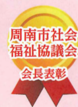
石丸 三枝 様