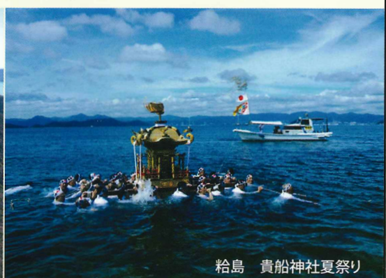
杓島 貴船神社夏祭り

鼓南地区は、徳山地域の東南部に位置する大島半島の南部と杓島を範囲とする地区で、北は籾浜地区と接しています。