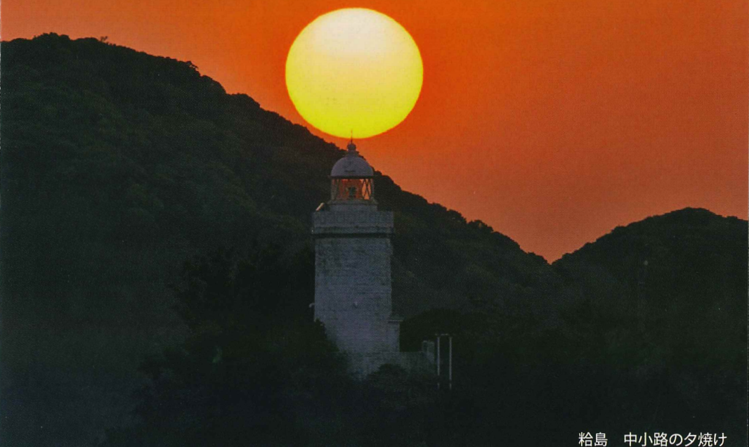
杓島 中小路の夕焼け