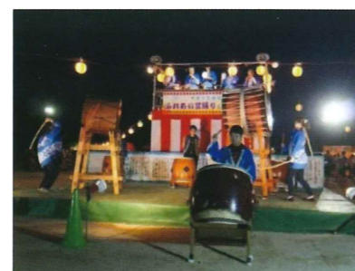
(ふれあい盆踊り&花火大会)