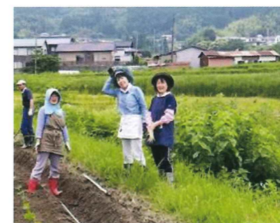
(黒豆友の会の活動)