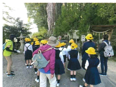
(放課後子ども教室)

13 須々万保育園と須々万幼稚園を統合して、「認定こども園」が開設されるのに合わせて、特色ある須々万教育の創造に取り組もう