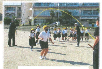
長縄跳びに挑戦中!