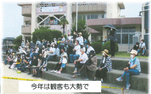
今年は観客も大勢で