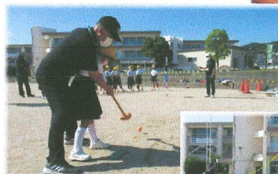
グラウンドゴルフを教わりました