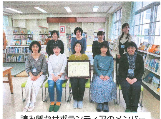
読み聞かせボランティアのメンバー

周陽小学校がチャレンジ目標に「読書」を掲げて以来、読み聞かせボランティアが在校児の保護者から広まり、保護者OBから地域へと広がりを見せて、今ではあたたかい雰囲気のある学校図書室の整備にも一躍かっおられます。