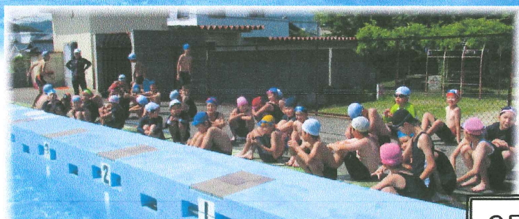
みんな待っていたプール!