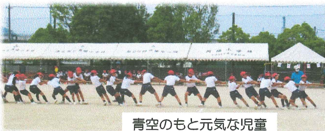
青空のもと元気な児童

コロナ禍で昨年は応援も制限されていましたが、今回は少し緩和されて家族の声援を力に