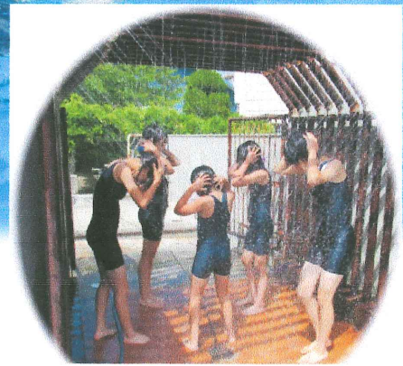
プールからあがって掛かり水