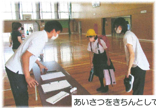
あいさつをきちんとして

運動場や校外の要所に地域の方が車の誘導などに携わり、より安全確実にそしてスムーズに訓練が行