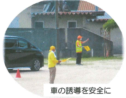
車の誘導を安全に

最近、様々な情報が飛び交い保護者の方も安心できない状況が起こりうる事が予想される中、こうした訓練は大変有意義だと強く感じました。