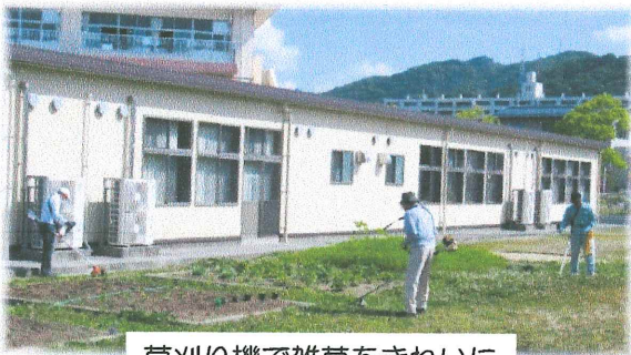
草刈り機で雑草をきれいに