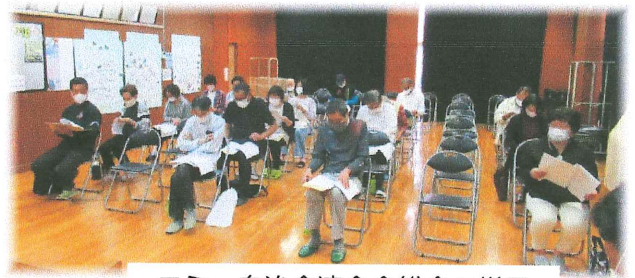
コミ・自治会連合会総会の様子

周陽地区の地域力を高めようか? 周陽地区の各団体の総会が書面開催・会場開催でそれぞれ終了し、それぞれの計画に基づいて今年度の活動が始まっています。 各団体が周陽地区の地域力を高めるために何をすれば良いのか、お互いに連携しながら協力をしていけたら本当の意味での周陽地区が安全・安心のまちづくりを目指していけるのではないかと思います。