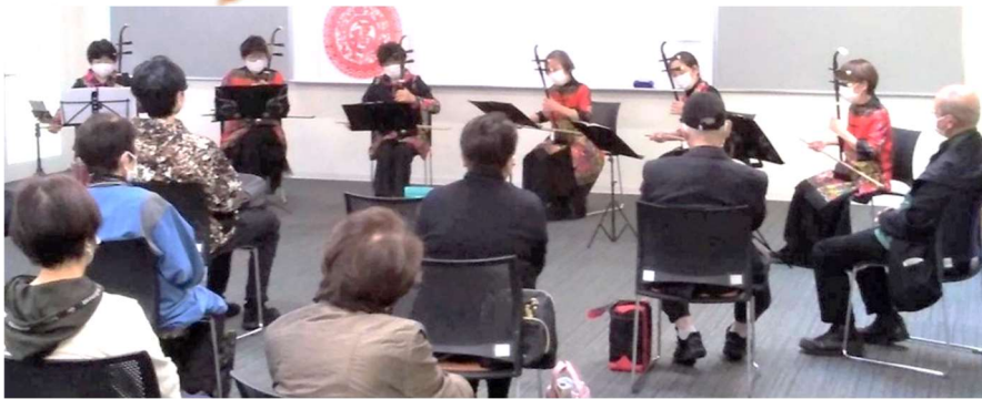
▲二胡は、二本の弦の間に弓を挟んで演奏します。