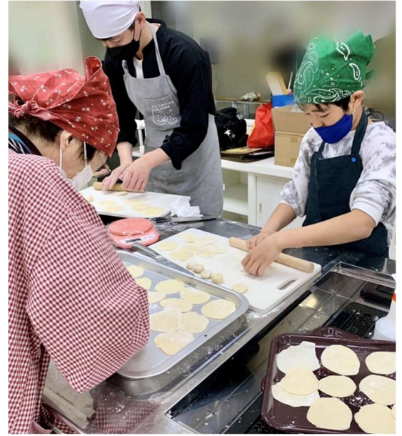
▲餃子の皮づくりの様子。 綺麗な丸い形に伸ばすのが難しい！