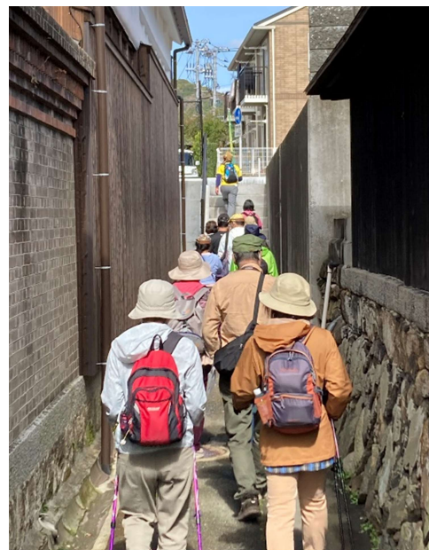
▲狛犬ウォークでは、出来る限り路地を歩くようなコース設定をしているそう。車では素通りするような道も、歩くことで新たな発見があります。

私はとにかく散歩が好きです。歩くからこそ辿り着く場所や見える景色があって、同じ道でも、季節とか時間で見える景色って全然違います。狛犬ウォークは、いつも1人で歩いていた道を、いろんな人のいろんな感想を聞かせていただきながら歩けるので、イベントの主催者側ではありますが、大変って気持ちはなく自分としてはすごく楽しいですし、それでなおかつ参加者の皆さんに楽しかったよって言うていただければ、私はなんの苦もないです。自分たち自身が楽しみながら活動をしています。