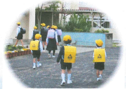
ランドセルカバーは新1年生です