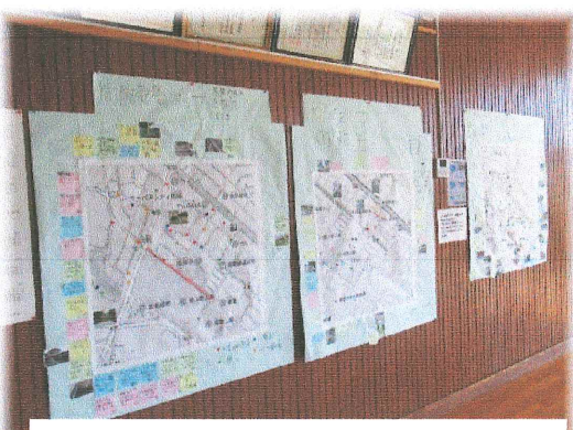
3グループに分かれて地区別に作成

周陽小学校六年生(当時の五年生)が、周陽の安全マップを製作しました。その製作したマップを周陽市民センターの講堂に掲示しています。コロナの感染で皆さんに見ていただくことがなわなかつたのですが、現在は講座がない場合に見ていただけます。「子どもヒーローの家」や災害時の危険なところ等よくできています。安全意識が高いことに驚かされます。