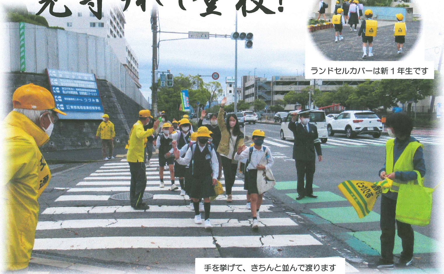
手を挙げて、きちんと並んで渡ります

子どもたちの登校時間に合わせて、交通安全協会のメンバー、保護者、スクールガードの人たちが地域の要所、要所に立って見守りをしています。