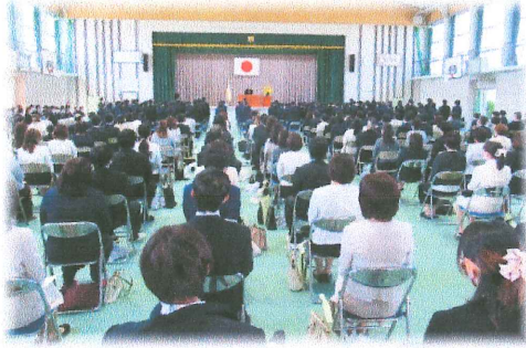
厳かな雰囲気の中で行われました