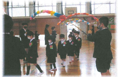
6年生が作った花のアーチを通りました

周陽小学校の入学式が行われ、今年度の新入児童21名を迎えました。在校生の姿が一段とたくましく見え、これからしっかり1年生のサポートができるだろうと思わせました。早く学校生活に慣れるといいですね。