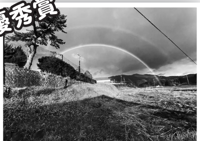
【スマホ部門】 「ダブルレインボー」 桑田小百合さん(市)