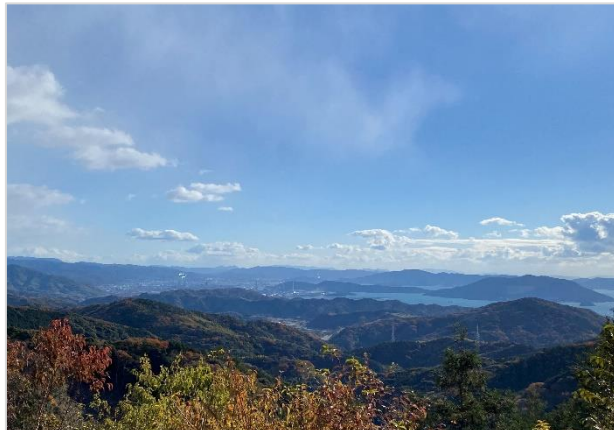
展望台からの景色