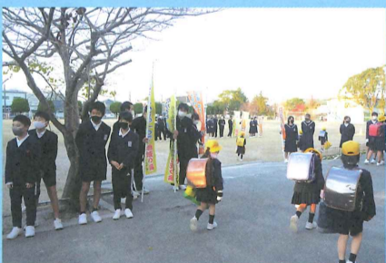
▲中学生と一緒にあいさつ運動