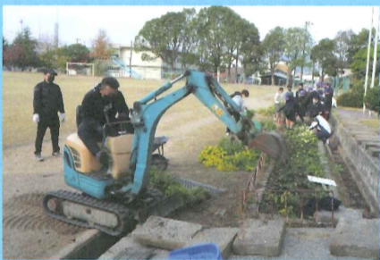
▲保護者・地域による学校環境整備