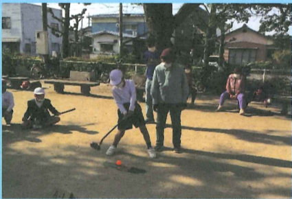
▲ライトグランドゴルフ