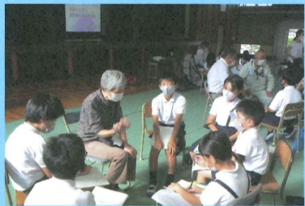
▲福祉について考える