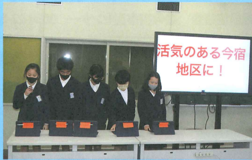
▲今宿地域のこれから!

昨年は、全学年の学習にたくさんの地域の皆さまが学習支援ボランティアとして参加してくださいました。