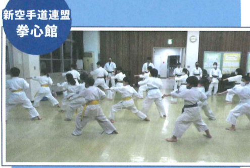
新空手道連盟 拳心館