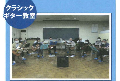
クラシック ギター教室