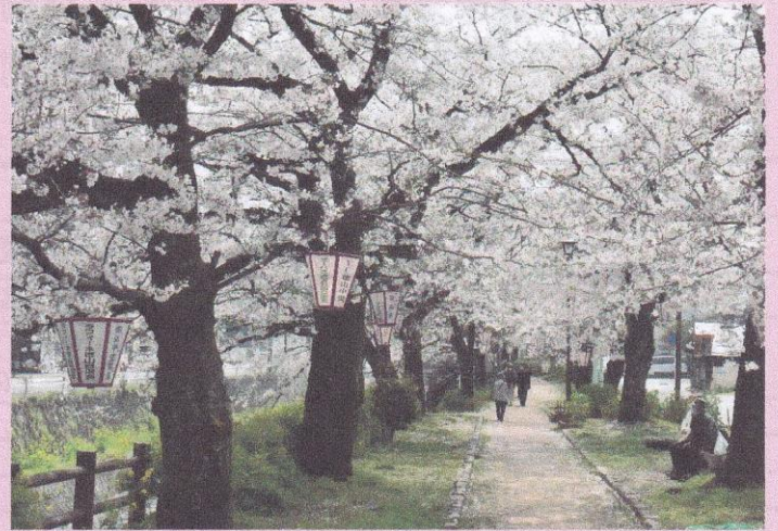
2021年度 優秀賞 丁田様の作品 思い思いに見る桜