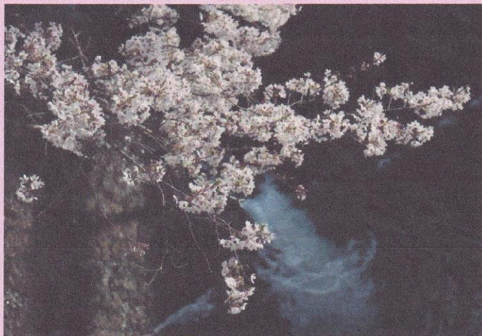
2021年度 優秀賞 福屋様の作品 朝陽刺す