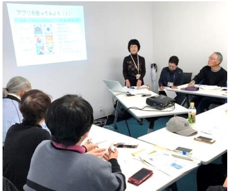
▲スマホ体験講座の様子