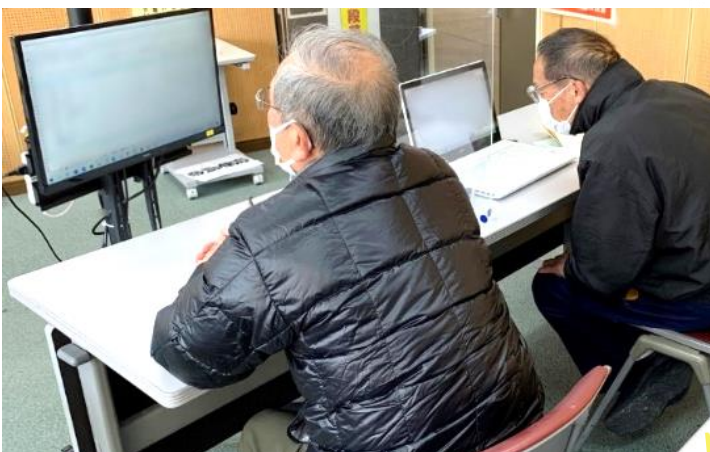
▲なんでも相談会の様子。現在はコロナ対策のため、テレビモニターやパーテーションを使用して開催中です。

毎週（月・木）、光市地域づくり支援センターにて「なんでも相談会」を開催中！ LINEの使い方、写真の整理方法など、マンツーマンで相談にのります。 その他、様々な講座も開催されていますので、ホームページもぜひチェックしてみてください◆*