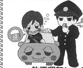
飲酒運転による人身事故件数(山口県) 【過去5年間】

飲酒運転は重大な交通事故を招きます。「少ししか飲んでいないから」「自分はお酒に強いから」という自分勝手な甘い考えは捨て、お酒を飲んだら運転は絶対にやめましょう。また、自分だけではなく、周囲の人も含めたみんなで「飲酒運転しない! させない!」という意識を持って、飲酒運転をなくしましょう。