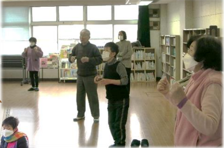
いきいき百歳体操