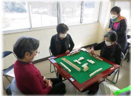
健康マージャンクラブ