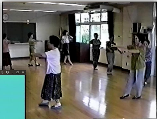
↑いつ頃の映像でしょうか？ 分かる方は教えてください(^_^)

大向コミュニティにより、大向市民センターに保管されていた大向音頭のカセットテープとVHSの修復が行われました。近年、再生する機会がなかったため劣化しており、特にVHSはカビが生えているなど、早急な対応が必要でした。 それぞれCDとDVDにダビングされ、無事当時の音源や映像が復元されました。大向の伝統文化や資料等を守っていきけるよう、これからも活動ができればと思います。映像や歌が気になる方は、ぜひ市民センターまで足をお運びください！