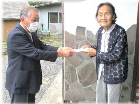
敬老会の代わりに記念品を配布。