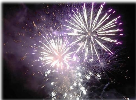
中学校から 400 発の花火を打ち上げ。