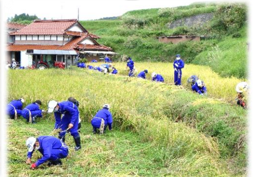
ウンカの被害も少なく、豊作でした。