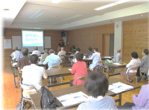
中須市民センターで指導会開催。