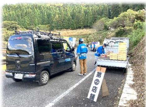
コロナ禍での新たなイベント取組み。