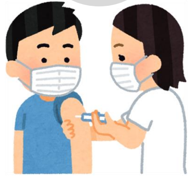
沼城小学校や須々万の病院でも実施。