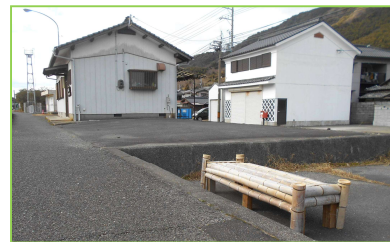
【写真】大島自治会館横

夢プランに挙げている「竹林の活用」の一環で、鼓南をよくする会の「かなえたい」が製作しました。今回は大島自治会館横、玉上造船所前(旧県道沿い)の2か所に設置しました。散歩中のひと休みなどに、どうぞご利用下さい。