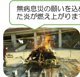
無病息災の願いを込めた炎が燃え上がります