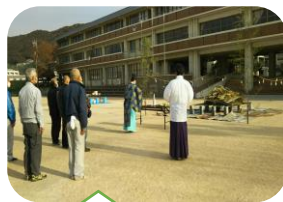
厳かに神事が執り行われました

手伝いいただきました地域の皆さんにお礼と同時にどんど焼きに参集された皆様のご利益をお祈りいたします。