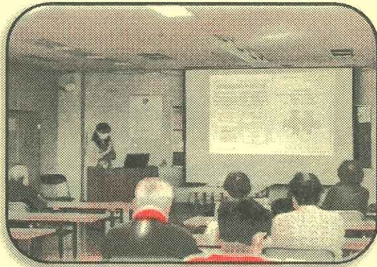
第2回はつらつ塾・熱心に聴講する講座生の皆さん

第1回 中心市街地の活性化について・・・賑わい交流施設整備事業(南北自由道路、駅前整備、図書館、交流施設、市民活動支援センター等)及びみなみ銀座周辺の再開発事業計画の概要など(10/8)