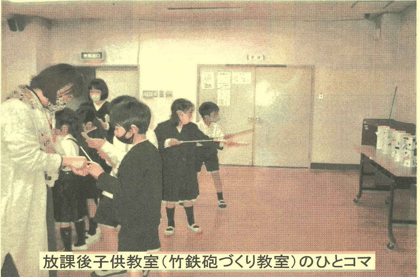
放課後子供教室(竹鉄砲づくり教室)のひとつコマ

秋月地区人口 6,128人 世帯数 2,831世帯 自治会数 13自治会 (令和 3年 10 月末現在) 年齢構成 0~14歳 730人 11.9%、15~64歳 3,564人 58.2%、65歳以上 1,834人 29.9% (うち100歳以上 2人)