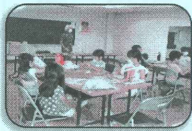
手作りパズル 知恵のヒモづくり