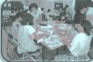
牛乳パックで小物入れとくるみボタンでキーホルダーを作ろう