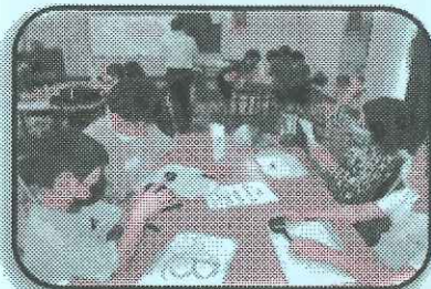
クイズにチャレンジ

子供たちは、暑さも忘れて最後まで熱心に取り組んでいました。今年の夏休みはきっと楽しい思い出となることでしょう。各教室の講師並びにボランティアの皆様には、たいへんお忙しい中をご協力いただき有難うございました。また、消しゴムはんこ万華鏡づくり、フォークダンス、けん玉教室の3教室は、新型コロナウイルスの感染リスクを避けるため、急きょ開催を中止いたしました。せっかくお申込みをいただいた児童の皆さんや保護者の方々には、たいへんご迷惑をおかけし深くお詫びいたします。