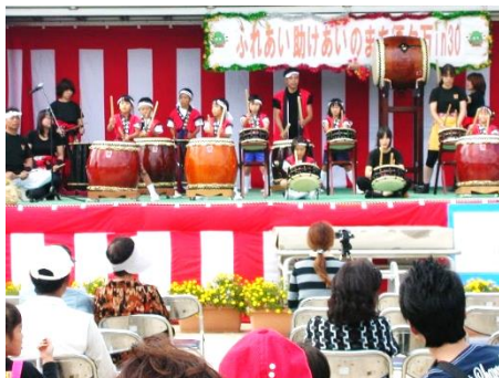
タイムカプセル開封式