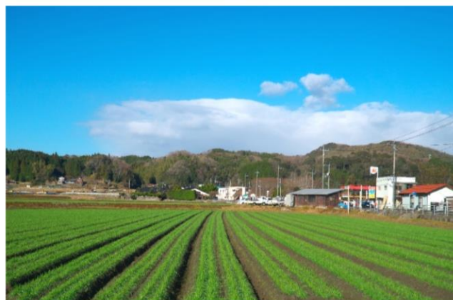
2020 最優秀作品 「幼麦並ぶ長畝」