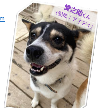
愛之助くん (愛称: アイアイ)