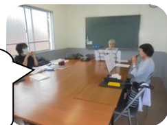
後半の部の練習風景、今回は休みの人もあり、ゆったりと練習!

オカリナサークルの皆さんは平成30年度(第44回)令和元年度(第45回)の文化祭に出演していただき文化祭を盛り上げていただきました。