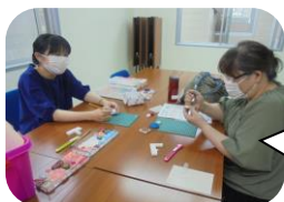
マンツーマンで指導を受け参加者は満足!