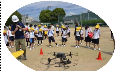
ドローンの飛行実演を見せてもらいました

6/19(土)岐山小学校で「地域防災ふれあい学習会・引き渡し訓練」が行われました。この学習会は岐山小、同校育友会、岐山地区自治会連合会が一昨年も開催し、今回はコロナ禍のため、児童と保護者を対象に行われました。今回も父親の会や警察署、県防災士会、建設会社などの協力をいただき、参加者は盛りたくさんの体験ができました。