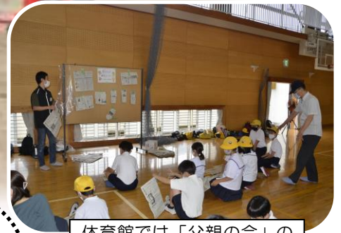
体育館では「父親の会」の指導で新聞紙でスリッパ作りを体験しました。