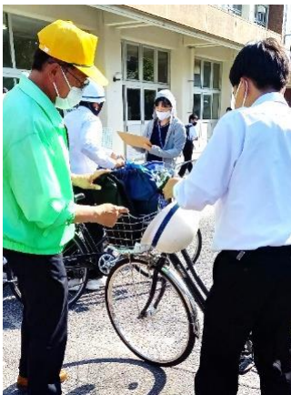
地域の方から 点検を受ける生徒

太華中学校では、自転車通学の生徒対象に、6月7日(月)、コムスク関係者、久米・榎浜の交通安全協会会員の協力のもと、下記の内容を重視し自転車点検が実施されました。点検整備を怠ると、交通違反となるだけでなく、交通事故の原因となってしまう可能性があります。毎月、地域の方の協力を得て実施される自転車点検で、自転車通学生徒の安全安心が守られています。自転車を利用される地域の皆さんも、日ごろから自転車の「日常点検」と「定期点検」を実施しましょう。