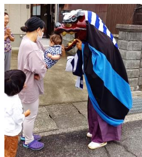
コロナを退治! 賢くなりませうように!

獅子舞には、疫病を退治したり悪魔を追い払ったりする意味があるようで、また、獅子舞に頭を噛んでもらえるとその年にご利益がもたらされる、頭が良くなるという言い伝えもあるそうです。