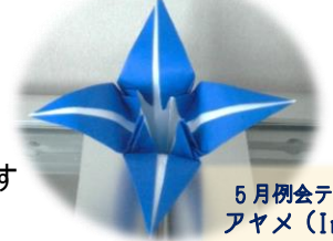
5月例会テーマ アイリス (Iris)

《“おりがみ”のメリット・・・①会話のツールになる ②メンタルヘルスがよくなる ③国際交流ができる》