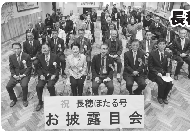
祝 長穂ほたる号 お披露目会