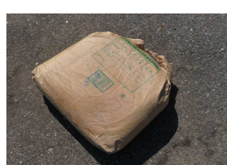
EMボカシ肥料 10kg 700円 残12袋