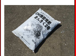
EM発酵堆肥 10kg 1400円 残18袋