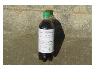
竹酢液 500ml 注文販売 100円