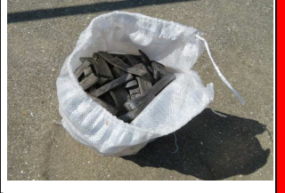
竹炭 10kg 500円 残12袋