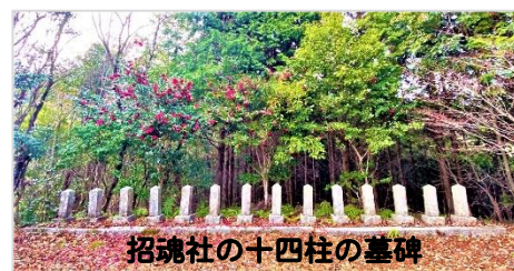
招魂社の十四柱の墓碑