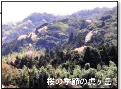
桜の季節の虎ヶ岳

標高 414m 周南市大河内と光市にまたがるようにしてそびえたつ虎ヶ岳は、新春登山をはじめ登山大会も開催され、地元の皆さんに愛されています。常安寺や溪月院が登山口になっています。