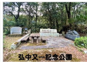
弘中又一記念公園